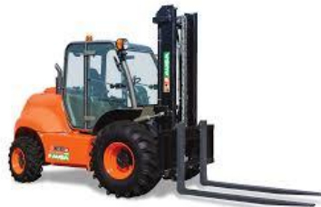
C 500 Hx4